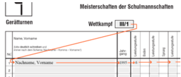
Abb. 4 um ins nächste Feld zu springen.