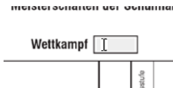
Abb. 2 Cursor ins erste hellgraue Feld setzen